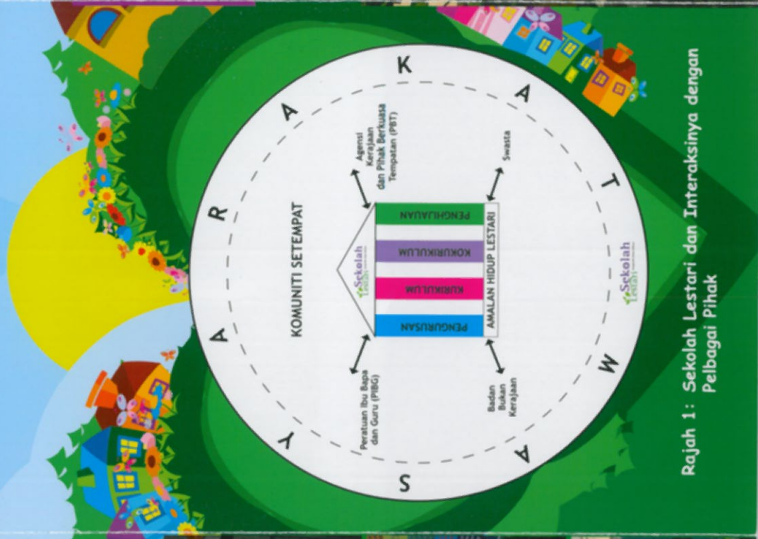
Rajah 1: Sekolah Lestari dan Interaksinya dengan Pelbagai Pihak

SEKOLAH LESTARI adalah suatu usaha bagi melaksanakan Dasar Alam Sekitar Negara. Dasar Alam Sekitar Negara mempunyai lapan prinsip dan tujuh strategi hijau. Strategi Hijau pertama memfokuskan aspek pendidikan dan kesedaran yang memberi kefahaman tentang konsep kesejahteraan alam sekitar dan pembangunan lestari, selaras dengan cadangan dalam Agenda 21.